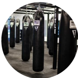
Наполнение спортивного инвентаря