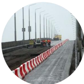
Ремонт мостов в качестве материала для закупорки стыков