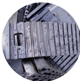
Изготовление подкладок под рельсы