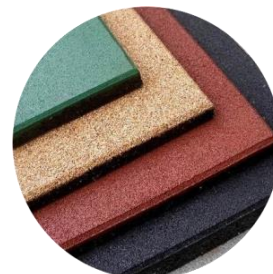
Производство резиновой плитки и прочих покрытий