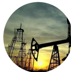
Тампонирование нефтяных скважин при бурении